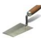
ELEMENTOS PARA APLICAR EL ADHESIVO, COMO LLANAS, ESPÁTULAS, ETC