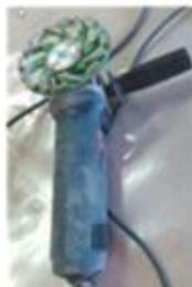
AMOLADORA CON DISCOS DE CORTE Y DESBASTE