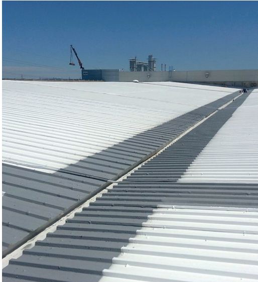
(%) Impacto Ambiental de los sistemas de cubiertas ( 10'000 m 2 )