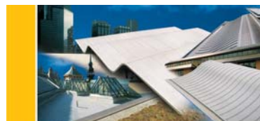
Manual de instalación Sarnafil TG/TS