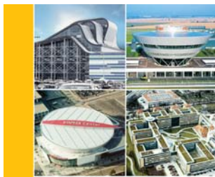
Tecnología de Sika y Conceptos para Cubiertas