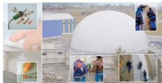
Manual del instalador