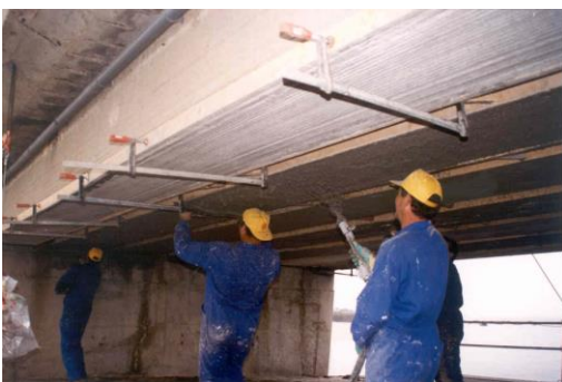
Proyección del Sika Monotop 612 como mortero de regeneración