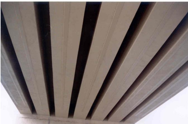
Acabado después de colocar el revestimiento de protección con Sikagard-670 Elastocolor