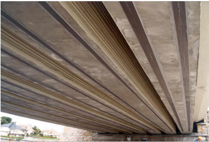
Colocación de los laminados de Sika CarboDur para refuerzo de las vigas