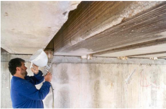
Proyección del Sika Monotop 910, para pasivar las armaduras y como puente de adherencia