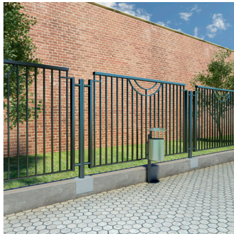
Anclaje y unión de perfiles metálicos.