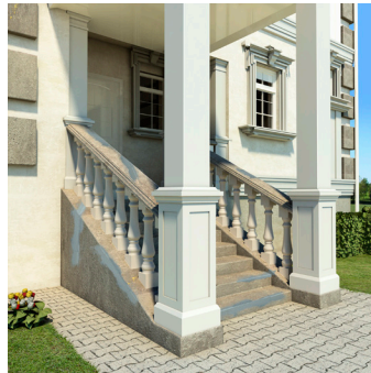
Reparación de parches.