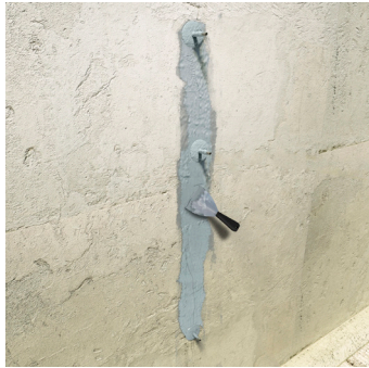
Relleno de grietas y sellado de fisuras.

Adhesivo epoxi que asegura una unión duradera