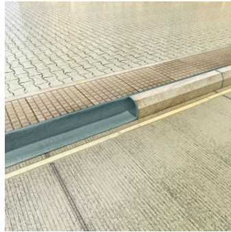
Unión de piedra y hormigón.