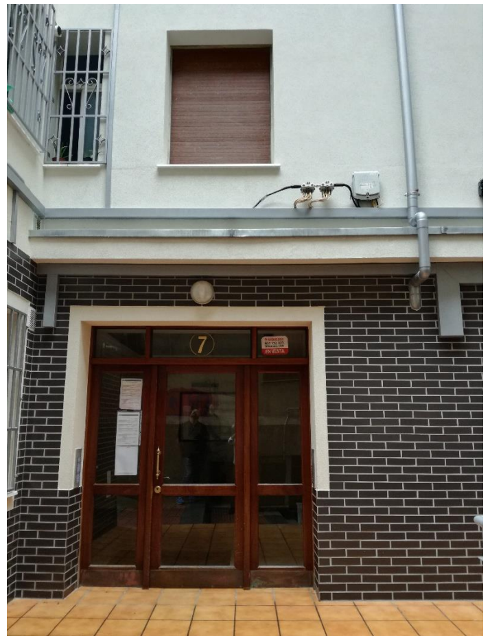
FACHADA TRASERA – Acabado cerámico combinado con acabado en mortero acrílico SikaThermocoat 5 TF

SIKA, S.A.U. Carretera de Fuencarral, 72. 28108 – Alcobendas. Madrid