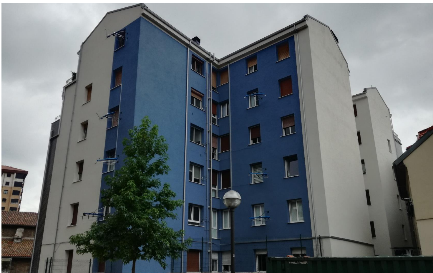
FACHADA TRASERA – Acabado acrílico SikaThermocoat 5 TF con color especial RAL 5014 – AZUL PALOMA

SIKA, S.A.U. Carretera de Fuencarral, 72. 28108 – Alcobendas. Madrid