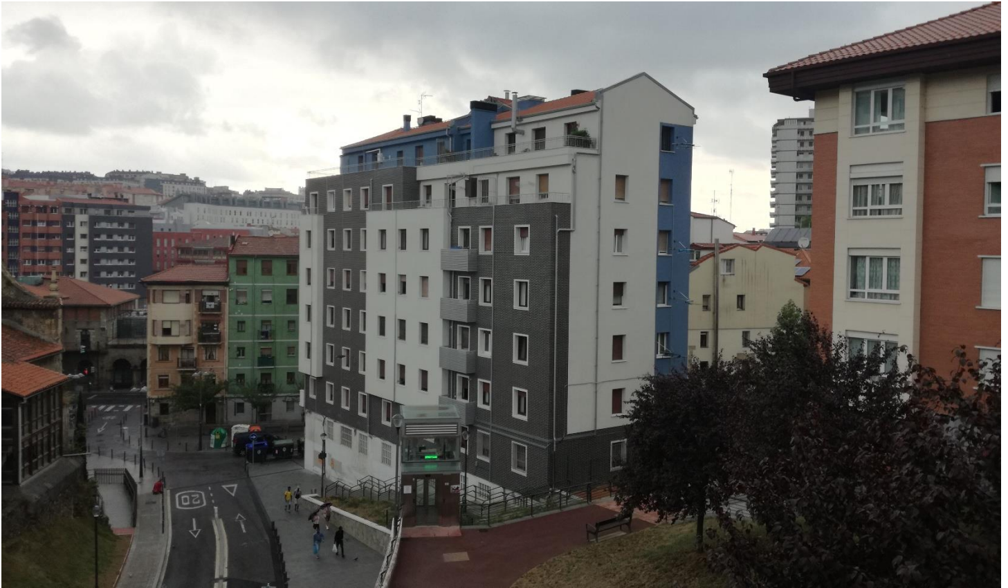
FACHADA DELANTERA / LATERAL – Acabado cerámico combinado con acabado en mortero acrílico SikaThermocoat 5 TF