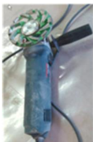
AMOLADORA CON DISCOS DE CORTE Y DESBASTE