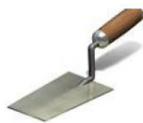
ELEMENTOS PARA APLICAR EL ADHESIVO, COMO LLANAS, ESPÁTULAS, ETC