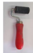
RODILLO DE GOMA DURO