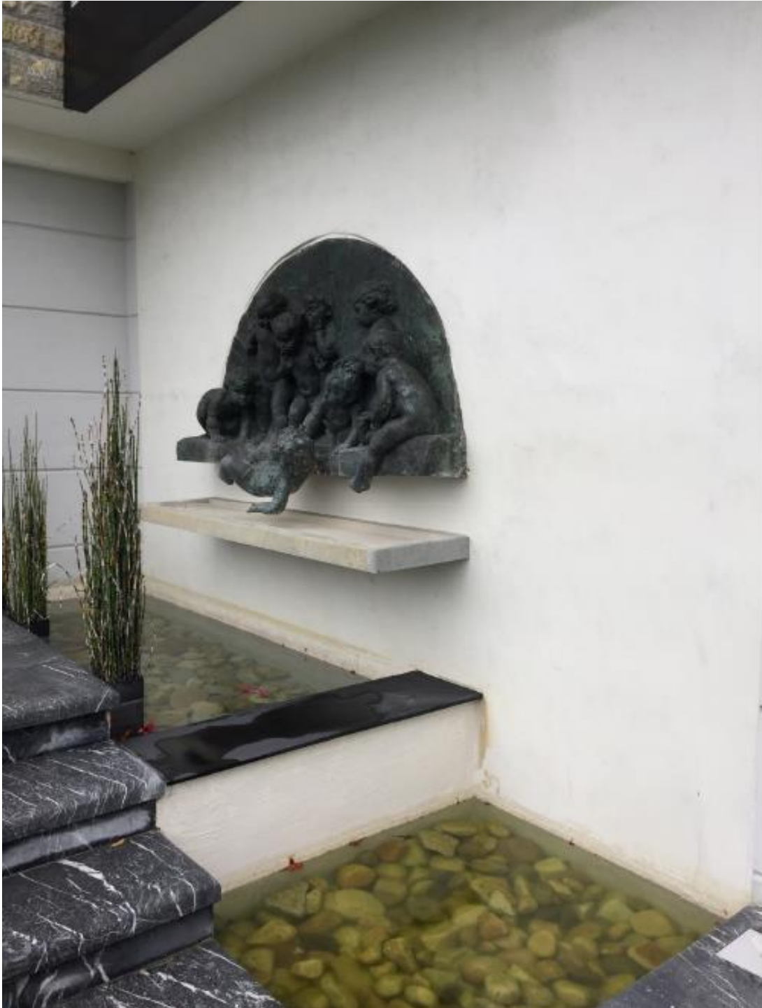
Vista del SIKADECOR 801 NATURE en color blanco ya *