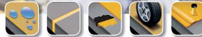
Impermeabilización Sellado y Pegado Rehabilitación Pavimentos Cubiertas