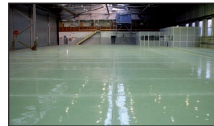
Premio “Pavimentos” 2011 “Taller Helicópteros Maestranza” Aplicador: Opteimsa