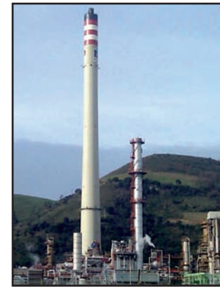
Premio “Pintura e Impermeabilización” 2011 “Chimenea de Petronor” Aplicador: ZUT