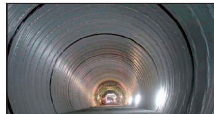
“Túnel del Gotardo, Suiza”