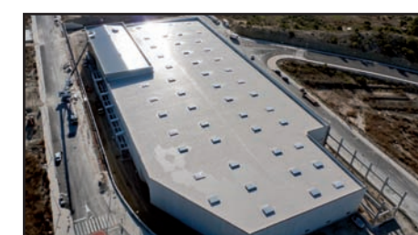
Premio “Impermeabilización con Membranas” 2011 “Cubierta Planta de Chocolates Xixona” Aplicador: Covaltia