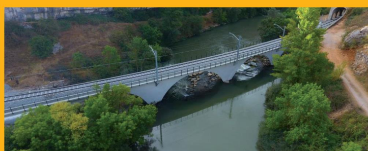
Mejor Obra 2016 Puente Pisuerga. TECYR