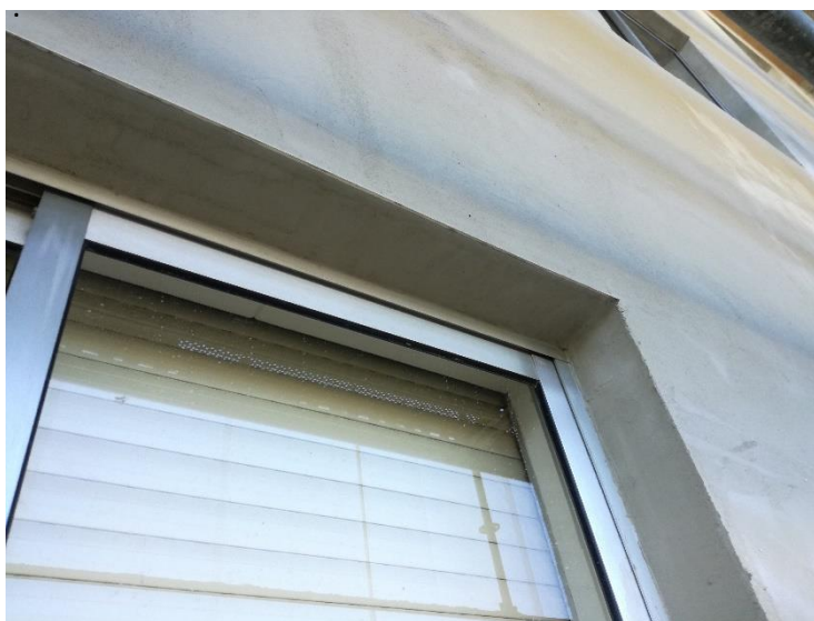
Perfil goterón de PVC con fibra de vidrio: SikaThermocoat 12