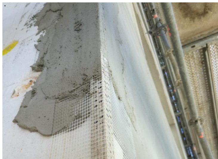
Perfil esquinero de PVC con fibra de vidrio: SikaThermocoat 6