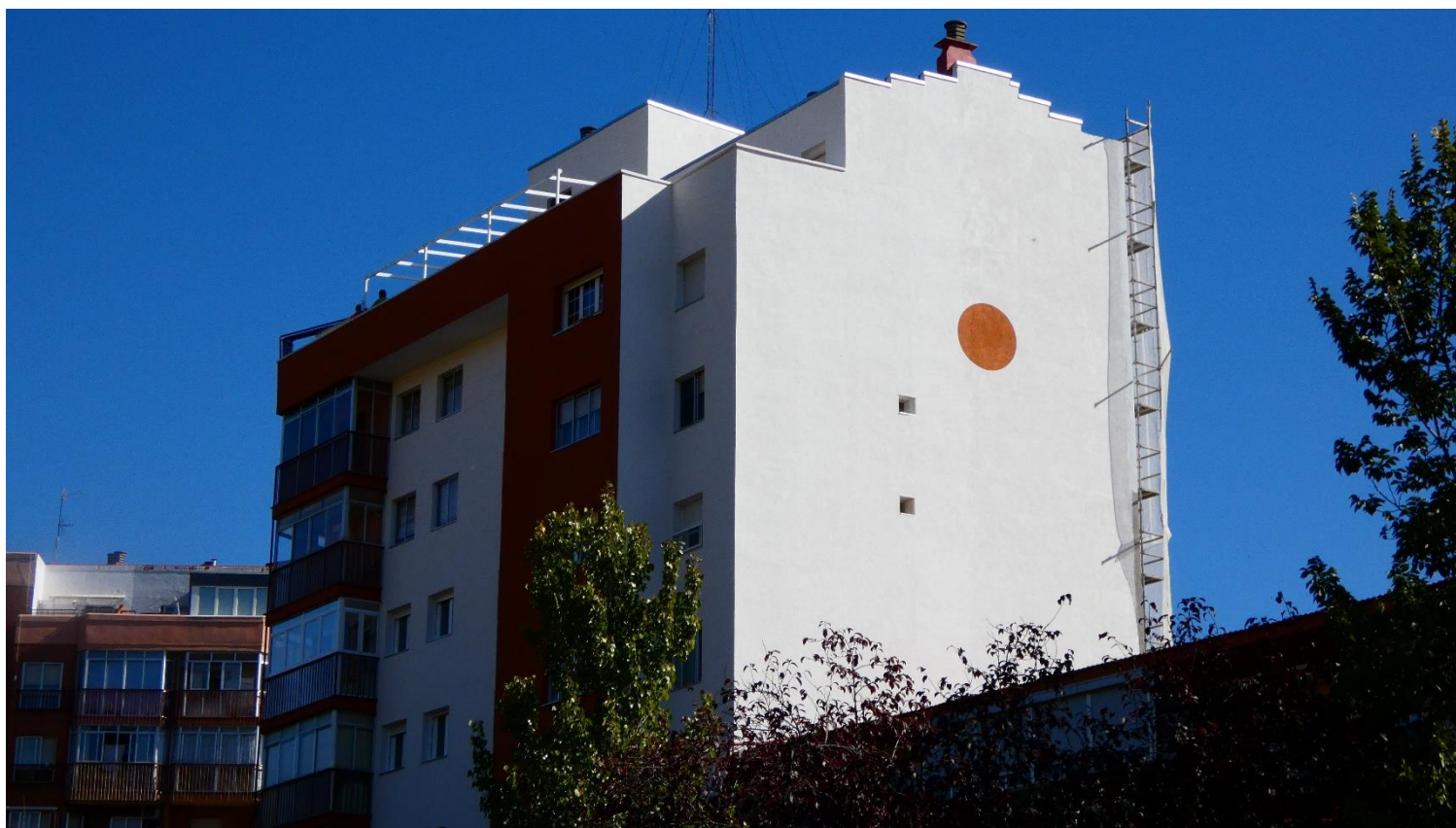
Edificio Renovado, detalle del revestimiento acrílico-mineral en colores ocre y blanco.