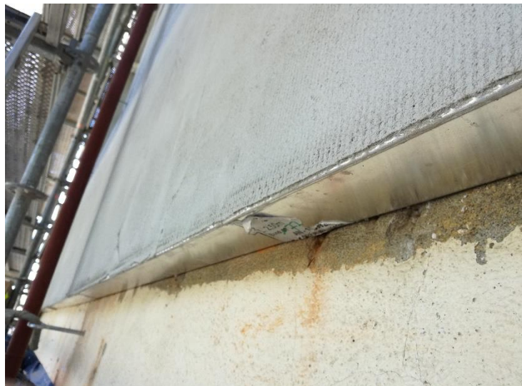
Perfil de arranque de aluminio: SikaThermocoat 7

Se finaliza la intervención con una capa de imprimación SikaThermocoat-5 TI, y terminado con SikaThermocoat-5-TF Siltec, revestimiento acrílico-mineral siliconado en dispersión acuosa para la impermeabilización y decoración de fachadas.