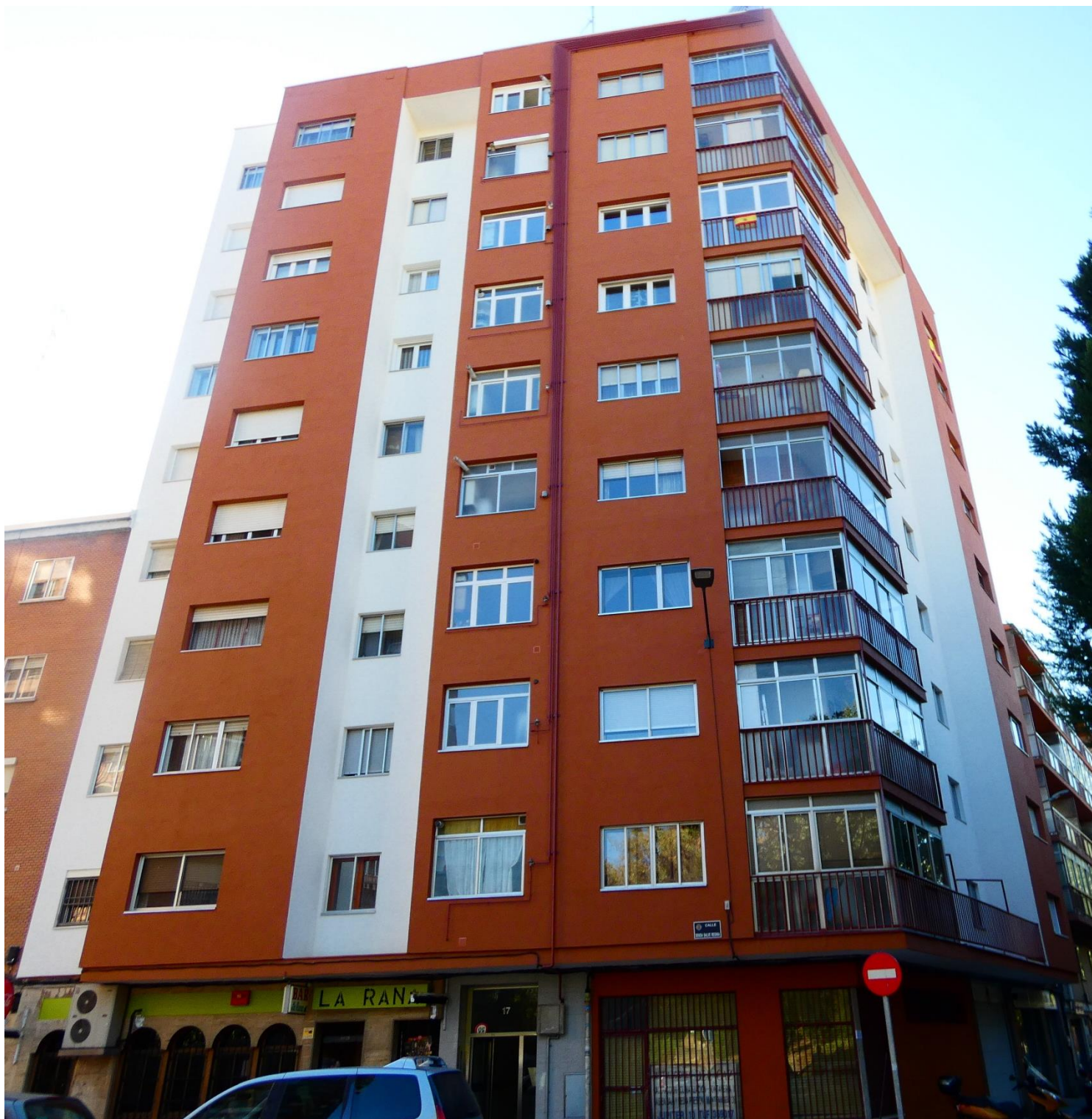
Edificio Renovado, detalle del revestimiento acrílico-mineral en colores ocre y blanco

SIKA, S.A.U. Carretera de Fuencarral, 72. 28108 – Alcobendas. Madrid