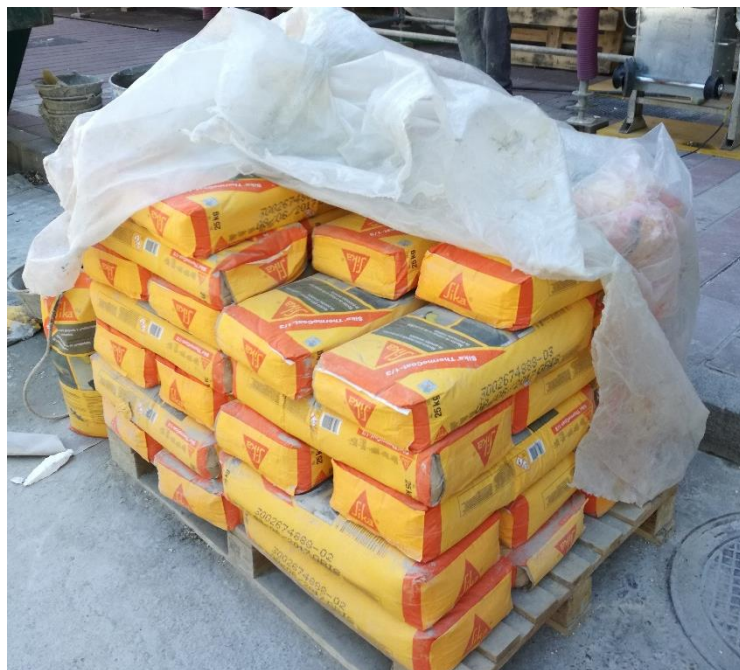
Mortero de pegado y regularización: SikaThermocoat 1/3.