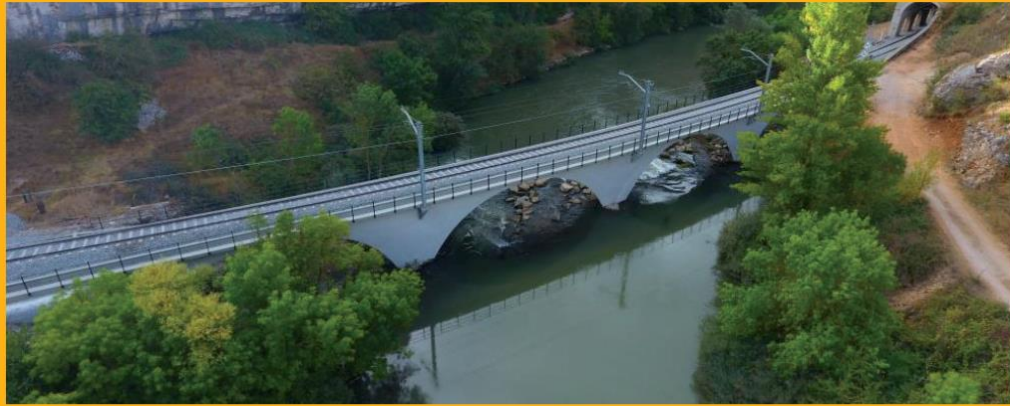
Mejor Obra 2016 Puente Pisuerga. TECYR