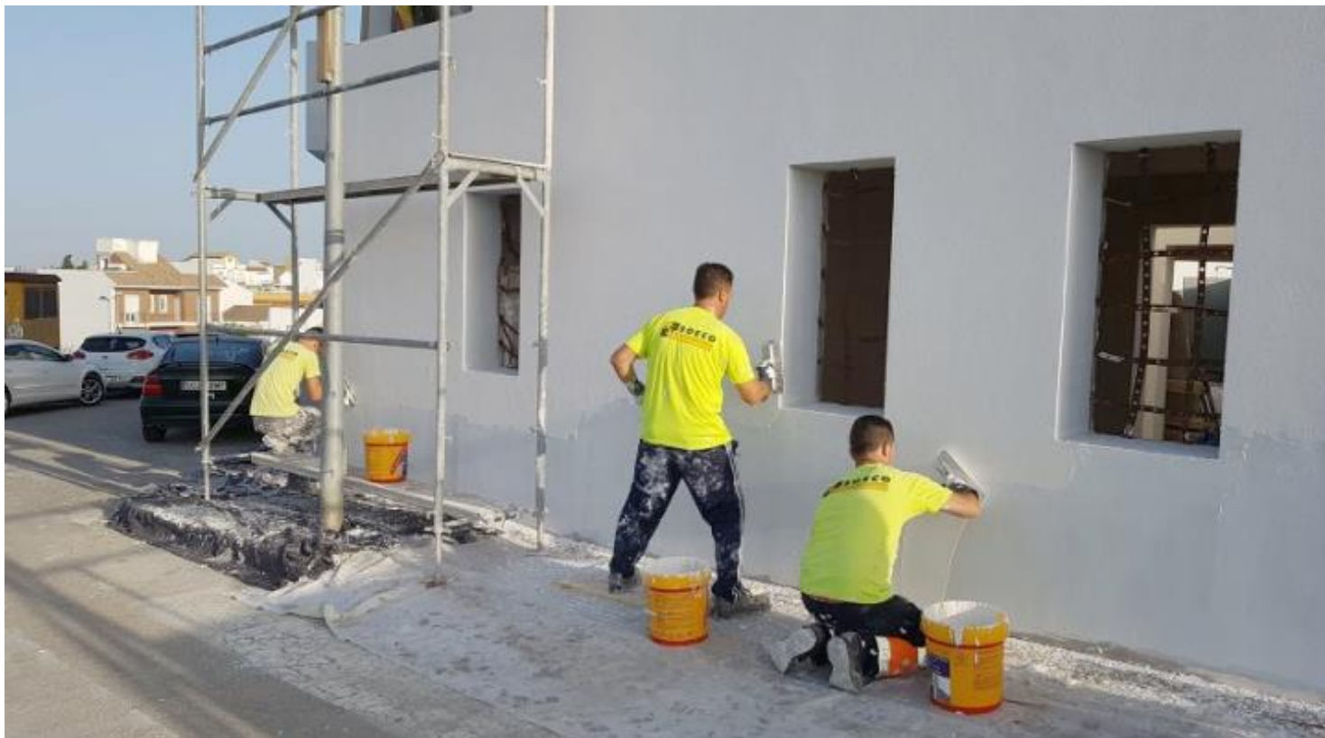
Aplicación revoco final SikaThermocoat 5 ES TF SILTEC