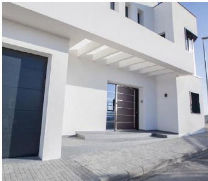
Fachadas – Acabado siliconado autolimpiable SikaThermocoat 5 ES TF SILTEC