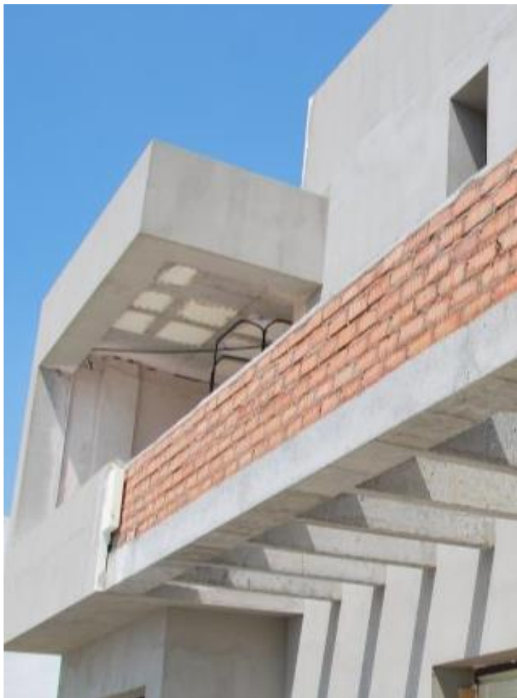
Mortero adhesivo y de endurecimiento SikaThermocoat 1/3