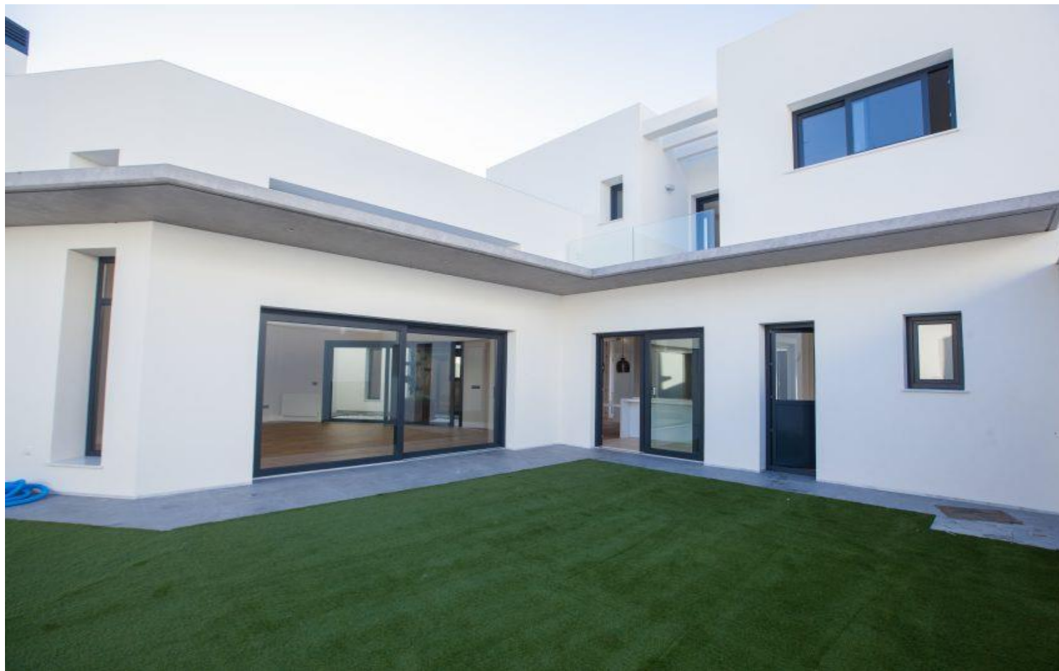
Vista interior – Revestimiento siliconado autolimpiable SikaThermocoat 5 ES TF SILTEC