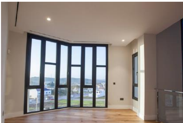
Interior – Detalle de huecos de fachada.