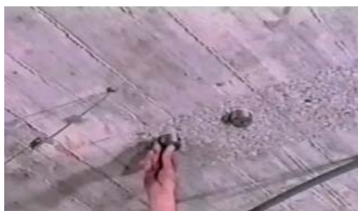
Pegado de las sufrideras sobre el soporte