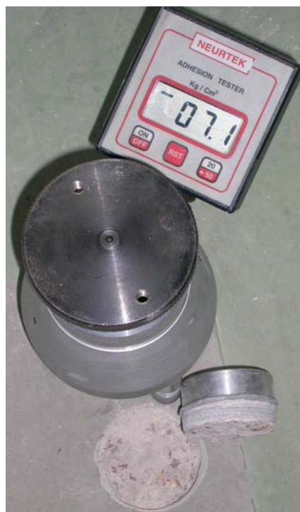
Ejemplo, Marca: NEURTEK