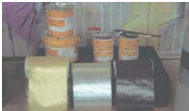
Gama de tejidos (aramida, vidrio, carbono)