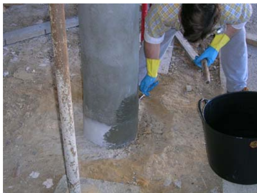
Imprimación del soporte mediante brocha

Se debe imprimir el soporte previamente con Sikadur-300, usando un rodillo o brocha. Si es necesario, aplicar una segunda capa de la resina de imprimación, después de que la primera capa haya penetrado en el hormigón.