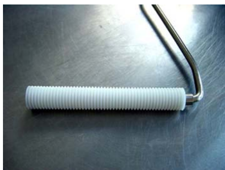
Rodillo de plástico