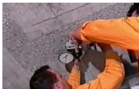
Arrancamiento de las sufrideras