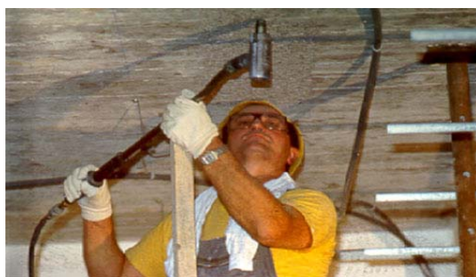
Preparación soporte: Abujardado mecánico