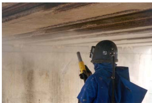
Preparación soporte: chorro de arena