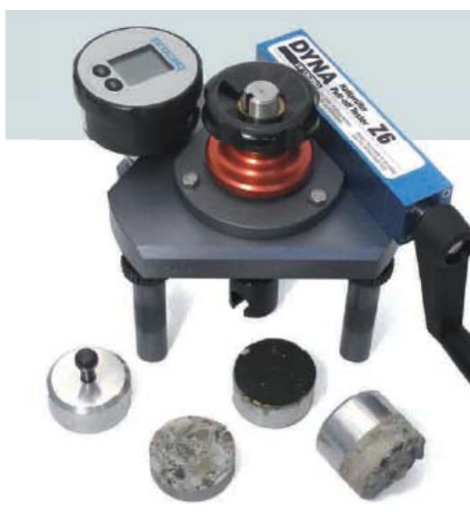
Ejemplo, Marca: DYNA