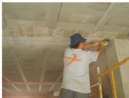
Preparación soporte: lijadora con disco de diamante