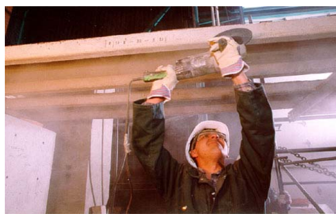
Preparación soporte: limpieza con radial