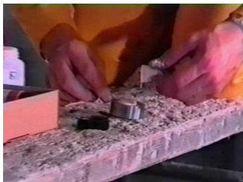
Aplicación de la resina en la sufridera