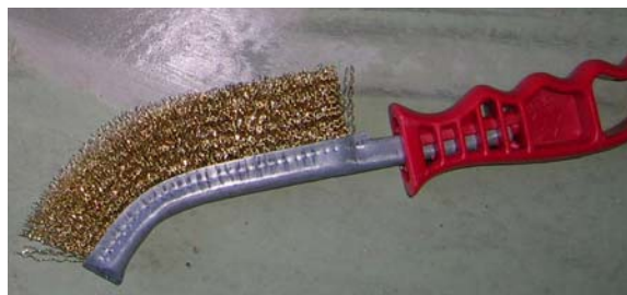
Cepillo de púas metálicas