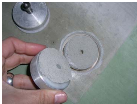
Corte realizado con una taladradora con corona de diamante